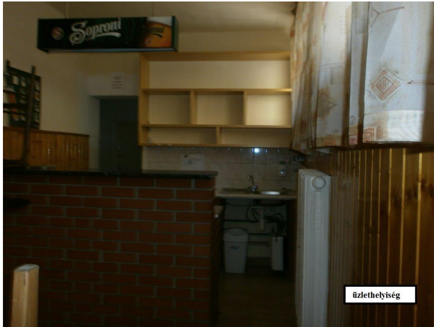
Szombathely 6749 hrsz.