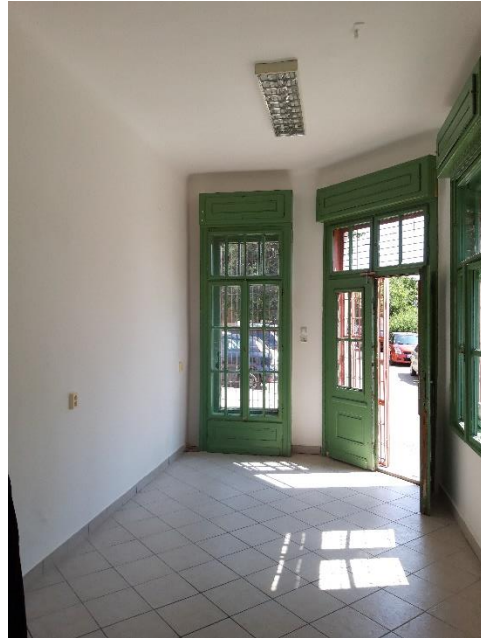
19,03 m 2 üzlethelyiség