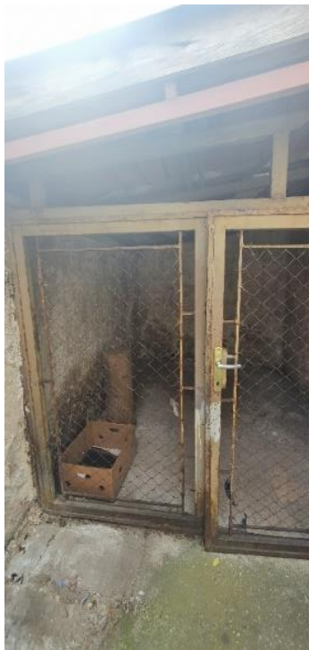
6,28 m 2 tároló