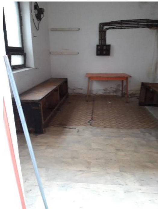
13,40 m 2 tároló