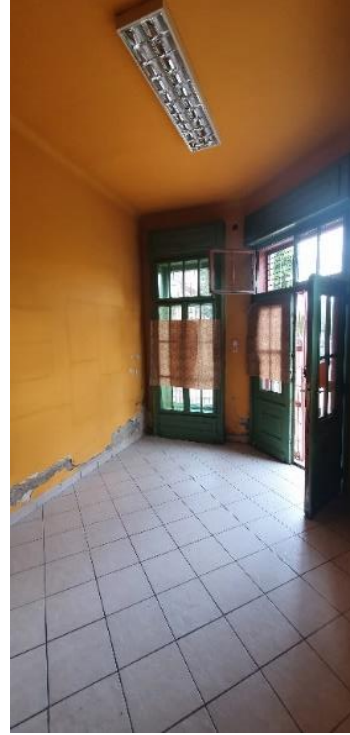
19,03 m 2 üzlethelyiség