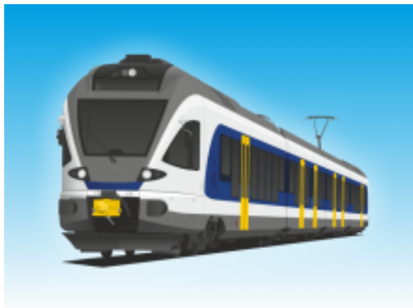
[1]Villamos motorvonat I. (FLIRT)

6 db kerékpár szállítható az utastér kijelölt részén (a lehajtható üléseknél) biztonsági övvel rögzítve.