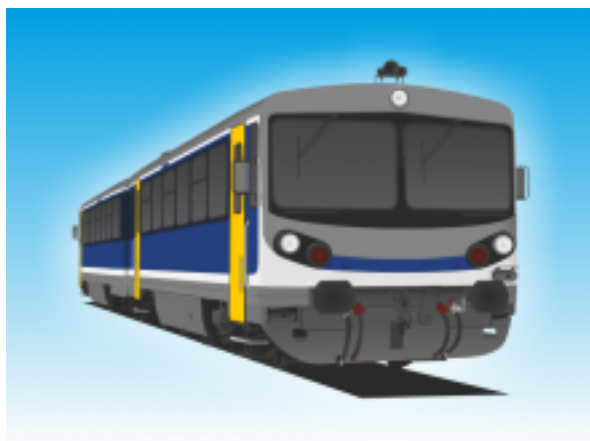
[13]Dízel motorvonat V. (Iker-Bz)

2 db kerékpár szállítható a kerékpár piktogrammal megjelölt vonatrészben.