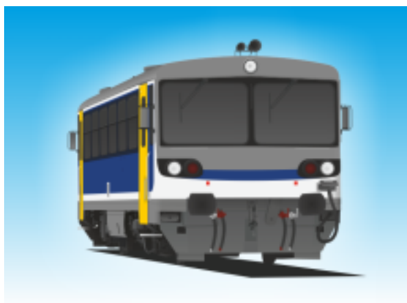
[11]Dízel motorvonat IV. (Bzmot)

2 db kerékpár szállítható kocsinként a többcélú térben (egyres járművek esetében kampókra akasztva).