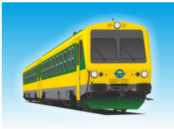
[9]Dízel motorvonat III. (Jenbacher)

5 db kerékpár szállítható a kerékpárszállító szakaszban kampókra akasztva.