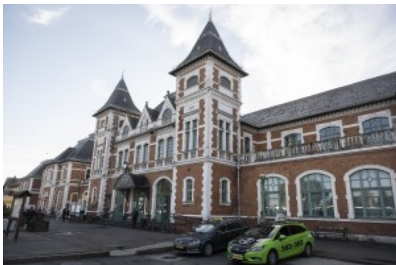
A Keleti pályaudvar és Miskolc között a megszokott menetrend szerint közlekednek az InterCityk

- Szinva InterCityként kell keresni a Keleti pályaudvar – Miskolc között közlekedő InterCityket a vágányzár ideje alatt, ezen a szakaszon ez az egyetlen változás,