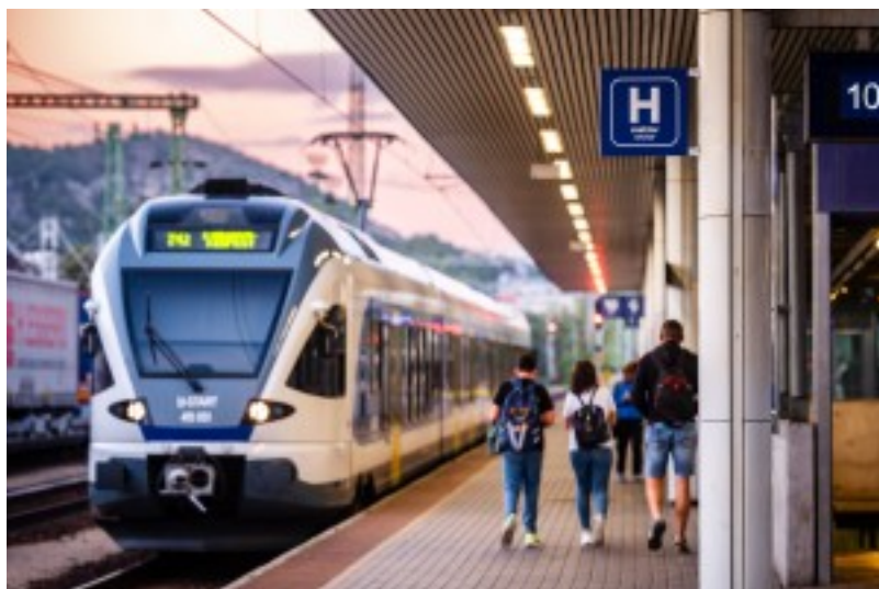
Mentesítő járat / relief service

2026 június 6-7. (szombat-vasárnap), 6th and 7th June 2026 (Saturday and Sunday)