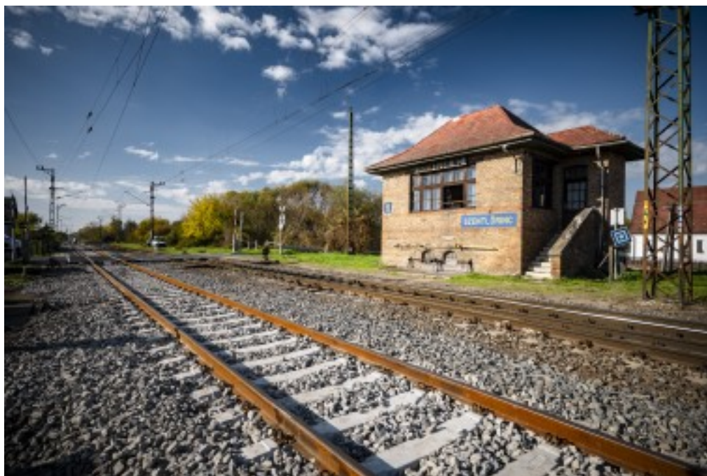
[2]vonal Szigetvárt és

Szentlőrincet összekötő szakaszán 80 kilométer/óra a megengedett legnagyobb sebesség, de a pálya műszaki állapota az elmúlt években oly mértékben romlott, hogy több szakaszon sebességkorlátozást kellett bevezetni, aminek következtében rendszeressé váltak a késések. A mostani munkálatok révén Szentlőrinc és Szigetvár között kiszámíthatóbbá válik a menetrend.